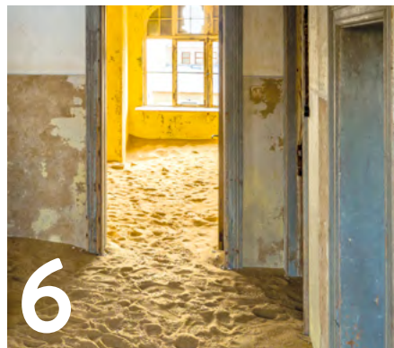
6 Fastenzeit Gott ins Herz holen