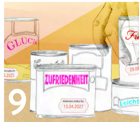
9 wandeln Zehn Jahre Fasten-Wegweiser