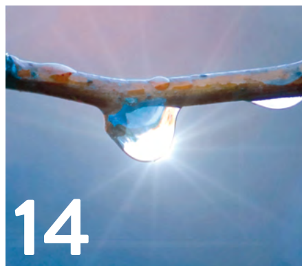
14 Karfreitag Eine Mordsgeschichte