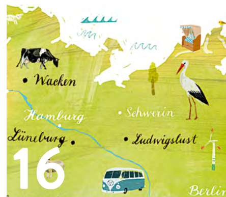
16 Hoffnung Unsere 30 Orte-Tour