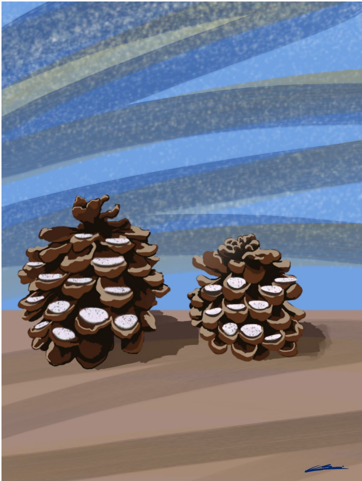
Illustration: Smilla Berg

Die korrekte Antwort in unserem Quiz lautet »B«. Der Gottesdienst am ersten Adventssonntag hat Jesu Einzug in Jerusalem zum Thema. Der zweite Advent steht für die Wiederkunft Christi, der dritte Advent